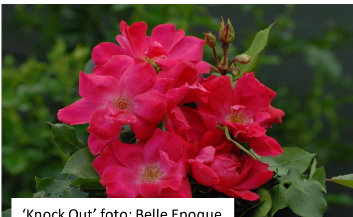
'Knock Out'

'Wedding Bells' ('KORSTEFALI') is een grootbloemige roos van Kordes. Ze werd ook door Tim Hermann Kordes veredeld in 2001 en in 2017 op de markt gebracht. De elegante zilverroze bloemen staan enkel, zijn gevuld en geuren goed met als hoofdtoon mirre en oude rozengeur. Alhoewel het blad goed bestand is tegen witziekte en bladplekken, kan in koude en vochtige weersomstandigheden een nieuwe vorm van roest optreden. Daarom heeft de firma Kordes beslist ze niet meer in de catalogus op te nemen.