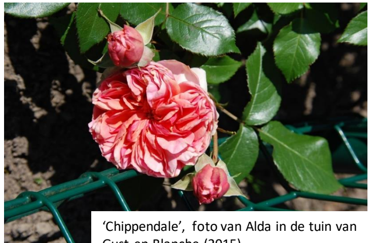
'Chippendale', foto van Alda in de tuin van Gust en Blanche (2015)

Floribunda, struik. Oranjeroze naar donker oranje. Sterke geur naar perzik en mango. Zeer vol (41 + bloemblaadjes), ouderwetse, in vieren geknipte bloeivorm. Hoogte van 80 tot 120 cm. Een roos van Hans Jürgen Evers (1940-2007) (2005). Bloeit het hele seizoen en is ongevoelig voor de weersomstandigheden (zon, regen, wind). De roos is ook zeer zelfreinigend. Een aanrader.