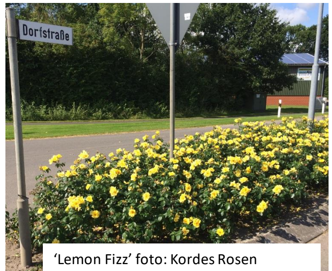
'Lemon Fizz'

'Lemon Fizz' ('KORFIZZLEM') werd reeds in 2001 door Tim Hermann Kordes veredeld, maar pas in 2017 op de markt gebracht. De heester wordt ruim een meter hoog en wat minder breed en heeft glanzend donkergroen blad. De lichtgele bloemen komen alleen of in kleine trossen en zijn enkel of dubbel. Deze roos verkreeg in 2015 het ADR-kenmerk.