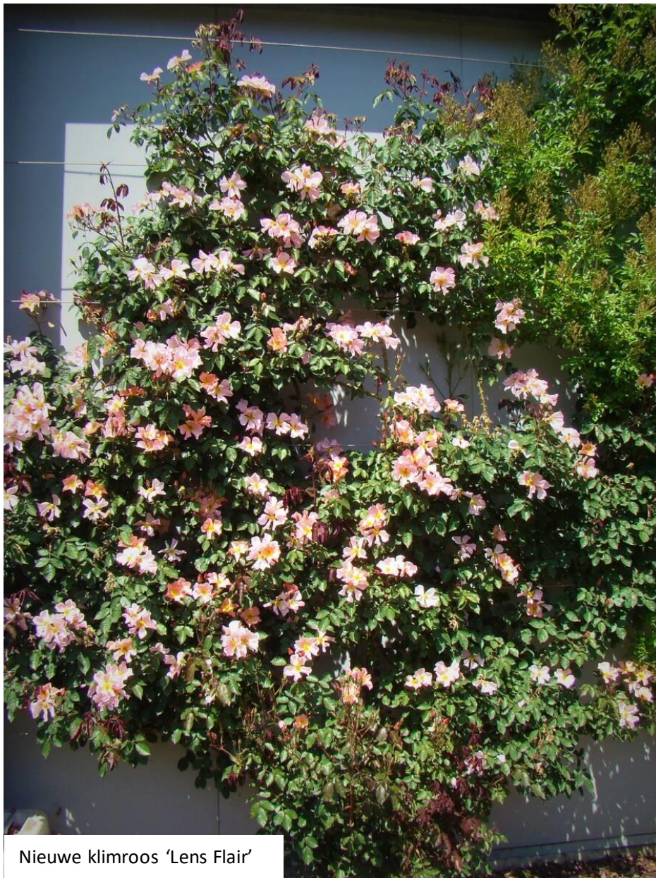
Nieuwe klimroos 'Lens Flair'

Met al onze plannen, kennis en passie zien we de volgende jaren rooskleurig tegemoet.