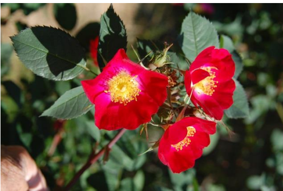
Rosa 'Canina von Kiese'

Het is niet gemakkelijk om 5 rozen te kiezen uit het grote aanbod. Hieronder volgt de keuze van onze vijf favoriete tuinrozen. Bij de oude rozen heb ik andere favorieten. Zij nemen veel plaats in en zijn niet geschikt om in de meeste tuinen te zetten. Toch wil ik ze even vermelden: 'Golden Chersonese', een mooie roos met opvallende gele roosjes en heeft zeer kleine lichtgroene blaadjes, Rosa 'Viridiflora' , de enige groene roos die veel gebruikt wordt bij bloemschikken, Rosa 'Canina von Kiese' , een variant van de hondstroos met opvallende rode bloemen, 'Minnehaha'. Deze staat bij ons in een perenboom van 10 meter hoogte en is in bloei zeer fotogeniek en als vijfde 'König Stanislaus', een roos van Hans Jurgen Evers die slechts één dag te koop is aangeboden, ter gelegenheid van haar doop in Zweibrücken.