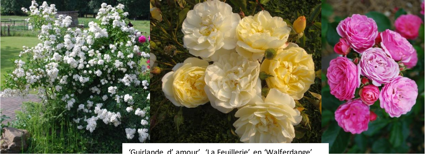
'Guirlande d' amour', 'La Feuillerie' en 'Walferdange'