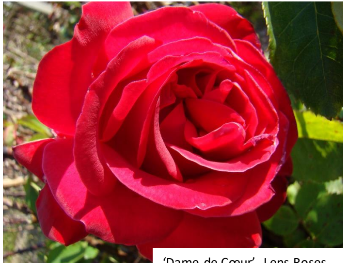
'Dame de Coeur', Lens Roses